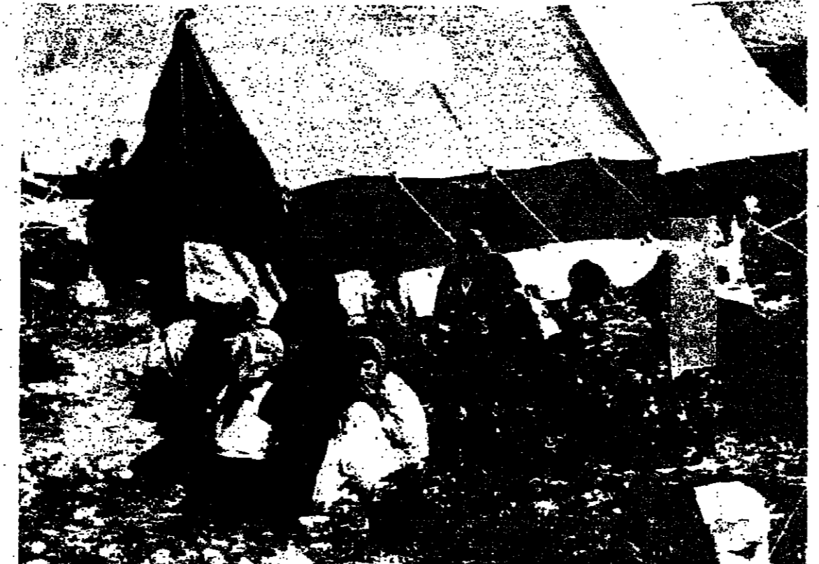
صورة لحانب من انعقاد اجتماع المجلس الوطني العربي في الناصرة امس...